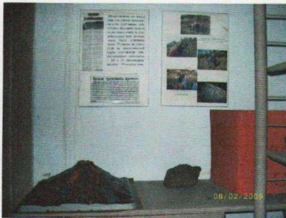
Вулканические бомбы, агаты.