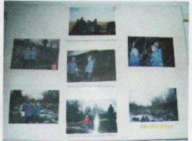
территории нынешнего села Лебёдкино вулкана.