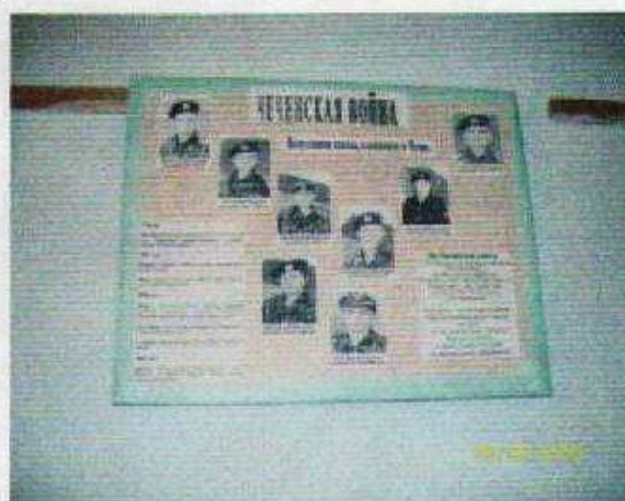
О выпускниках школы, служивших в Афганистане и Чечне